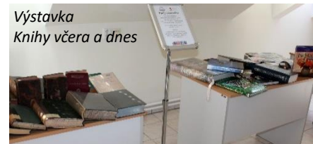
Výstavka Knihy včera a dnes