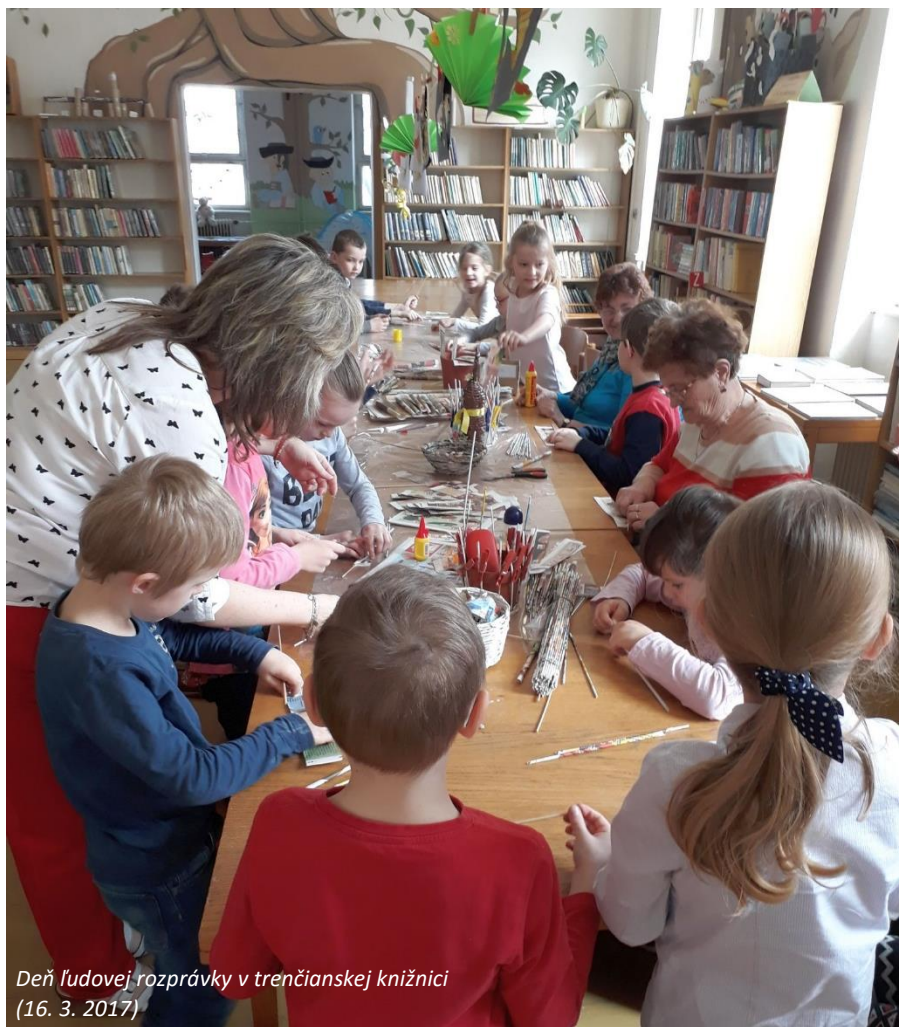
Deň ľudovej rozprávky v trenčianskej knižnici (16. 3. 2017)