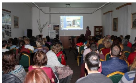
Róbert Margoč: Irán a jeho perzské dedičstvo