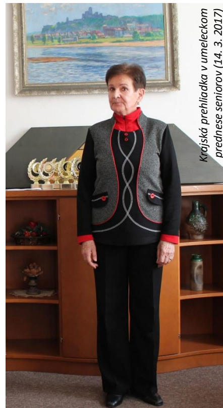
Krajská prehliadka v umeleckom prednese seniorov (14. 3. 2017)