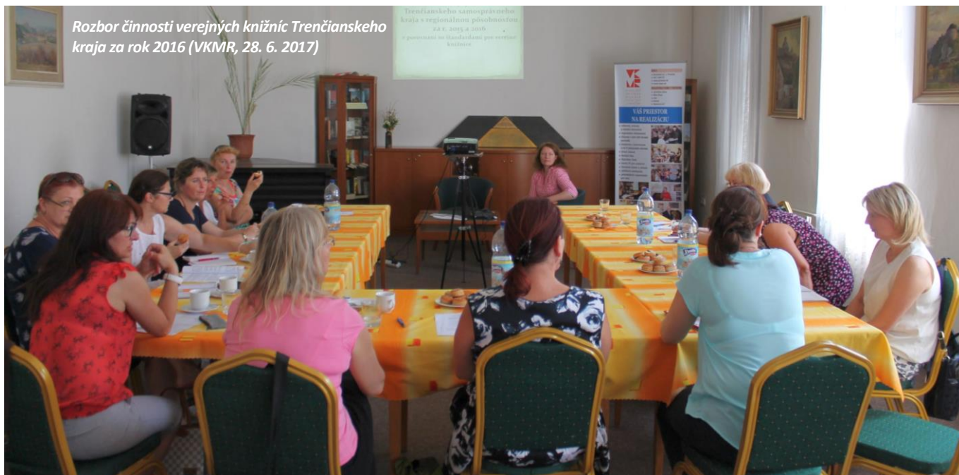
Rozbor činnosti verejných knižníc Trenčianskeho kraja za rok 2016 (VKMR, 28. 6. 2017)